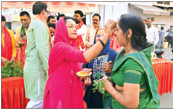
विदिशा। महिलाओं ने एक दूसरे को तिलक लगाकर दी हिंदू नववर्ष की बधाई।

चैत्र नवरात्रि के शुभारंभ के साथ ही पूरे जिले में भक्ति और आस्था का अद्भुत माहौल देखने को मिला। पहले ही दिन शहर के प्रमुख देवी मंदिरों में श्रद्धालुओं की भारी भीड़ उमड़ पड़ी। सुबह आरती के साथ ही दर्शन का सिलसिला शुरू हुआ, जो देर शाम तक जारी रहा। मंदिर परिसर जय माता दी के जयकारों से गूंज उठे। श्रद्धालुओं ने परिवार की सुख-समृद्धि और खुशहाली की कामना करते हुए पूजा-अर्चना की। माधवगंज पर भी कार्यक्रम आयोजित कर हिंदू नव वर्ष पर तिलक लगाकर नीम और मिश्रा का वितरण किया गया।