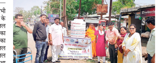
हरिभूमि न्यूज विदिशा

जनपद पंचायत ग्यारसपुर की सभी ग्राम पंचायतों में शासन के निर्देशानुसार 19 मार्च 2026 से जल गंगा संवर्धन अभियान-2026 का शुभारंभ किया गया। अभियान का उद्देश्य जनजागरूकता बढ़ाकर जल संरक्षण को प्रोत्साहित करना, जल स्रोतों का जीर्णोद्धार करना तथा पेयजल व्यवस्थाओं की साफ-सफाई सुनिश्चित करना है। ग्राम पंचायत ग्यारसपुर में जनपद पंचायत कार्यालय के बाहर अस्पताल परिसर के पास जनजागरूकता एवं सर्वेक्षण कार्यक्रम आयोजित हुआ।