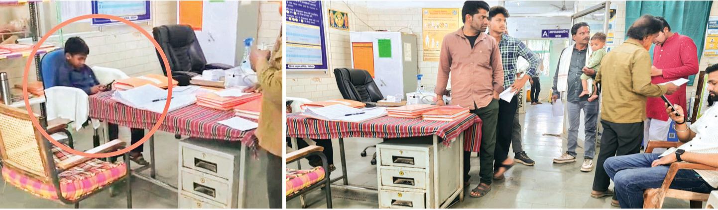
हरिभूमि न्यूज सिरोंज

मरीज बोले - पहले पर्ची बनवाने घंटों किया कर्मचारी का इंतजार, फिर नर्स मैडम ने लाइन में खड़ा रखा