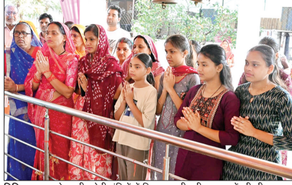
विदिशा। शहर के प्राचीन देवी मंदिरों में दिनभर लगी रही श्रद्धालुओं की भीड़।

प्रशासन ने की सुरक्षा व्यवस्था, मंडी में हुई नीलामी श्रद्धालुओं की भीड़ को देखते हुए प्रशासन ने मंदिरों के बाहर पुलिस बल, बैरिकेडिंग, पेयजल और साफ-सफाई की व्यवस्था की गई। वहीं कृषि उपज मंडी में व्यापारियों ने धर्म ध्वजा के साथ पूजा-अर्चना की। इसके बाद नीलामी में भाग लिया, जिससे व्यापारियों में उत्साह देखा गया।