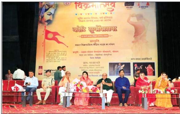
विदिशा। ऑडिटीरियम में आयोजित कार्यक्रम में मौजूद जनप्रतिनिधिगण।

प्रदेशव्यापी विक्रमोत्सव 2026 के अंतर्गत कोटि सूर्य उपासना कार्यक्रम का आयोजन जिले में उत्साहपूर्वक किया गया। कार्यक्रम का शुभारंभ राज्यमंत्री कृष्णा गौर