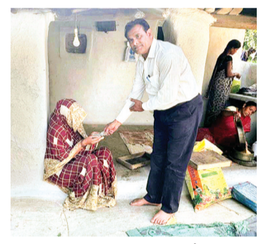
हरिभूमि न्यूज सिरोंज