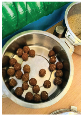
रहे हैं। स्थिति यह है कि बच्चे लड्डू खाने से बच रहे हैं और उन्हें घर लें जाकर जानवरों को खिला रहे हैं।

ग्यारसपुर तहसील क्षेत्र के हैदरगढ़ सहित आसपास के गांवों में आंगनबाड़ी केंद्रों पर वितरित किए जा रहे पूरक पोषण आहार की गुणवत्ता पर गंभीर सवाल उठे हैं। ग्रामीणों और अभिभावकों ने आरोप लगाया है कि अमेरिकन फाउंडेशन द्वारा उपलब्ध कराया जा रहा थर्ड मिल (लड्डू, पोहा आदि) गुणवत्ताहीन है, जिससे बच्चों के स्वास्थ्य पर विपरीत असर पड़ रहा है। अभिभावकों के अनुसार कई बच्चे भोजन करने के बाद उल्टी-दस्त जैसी समस्याओं से पीड़ित हो