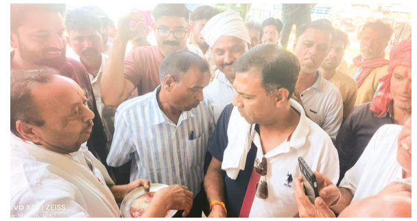
हरिभूमि न्यूज सिरोंज

हिन्दू नव वर्ष, गुड़ी पड़वा के उपलक्ष में सिरोंज मंडी हमेशा खुलती है और व्यापारी अपना श्रेष्ठ मुहूर्त में माल की खरीदी करते हैं व्यापारी नव वर्ष के उपलक्ष में एक दूसरे को बधाई देते हैं और इस खुशी के मौके पर कर्मचारी और किसानों को मिठाई खिलाकर एक दूसरे को बधाई देते हैं। नववर्ष के अवसर पर मण्डी में बंपर आवक रही दशहरा मैदान में लगभग 300 ट्रॉली गेहूं की आई